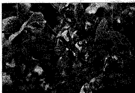
Blomstrende blåbærbusk af vores egne danske vilde blåbær: Vaccinium myrtillus.